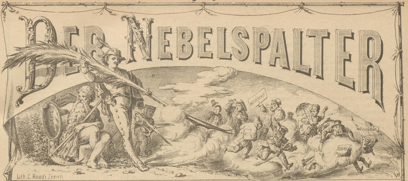
Lith. C. Knüsli, Zürich