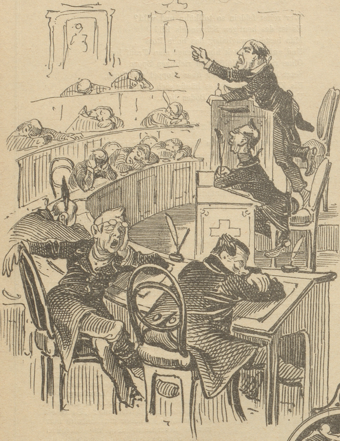
Bei uns schläft man ganz wonniglich;