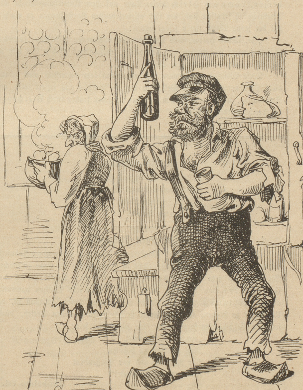
Ha! sollte wohl die Frevlerin gewagt in meiner Liebe Heiligthum sich haben?