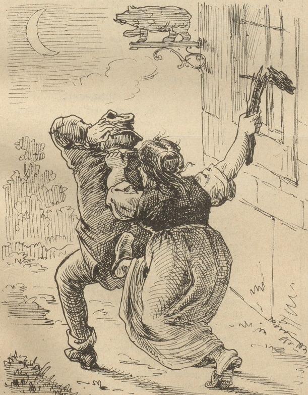
Einst begleiten ihre Trauerschläge einen Wandrer auf dem letzten Wege.