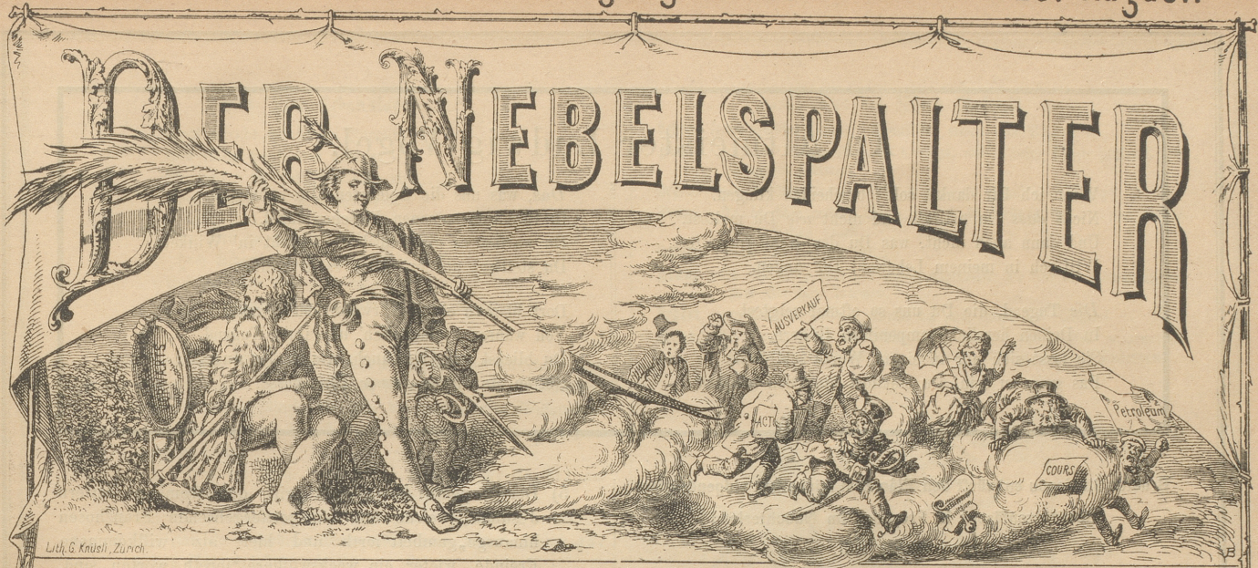
Lith. G. Knusi, Zürich.