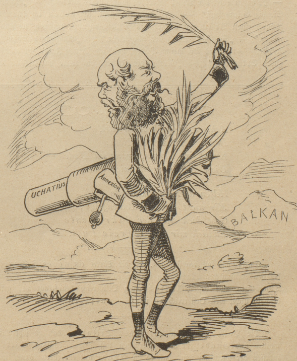
„So lange Oesterreich seine hinterlistige Politik nicht aufgibt, kann ich nicht sein Freund sein!“ (W. G. Gladstone.)