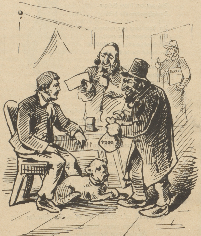
Aber man hilft ihm, bis er nichts mehr hat.