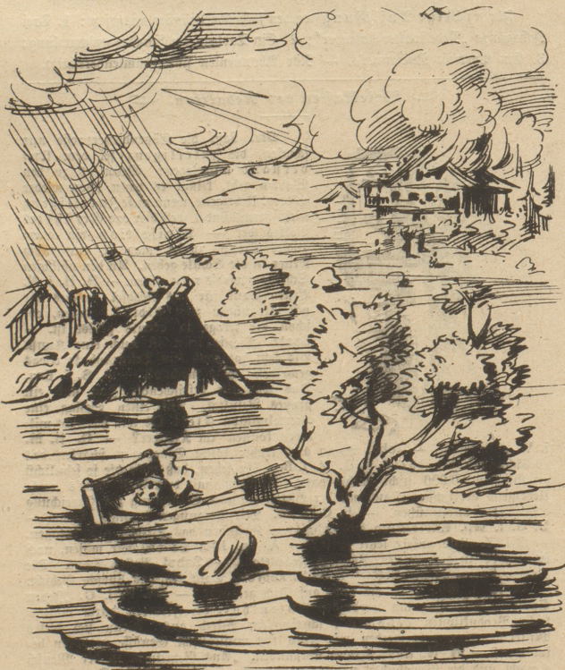
Selbst von Seite des Himmels erfreut er sich besonderer Aufmerksamkeit. * Nicht zu reden vom Staate, der sein Wohl so gut als möglich fördert.