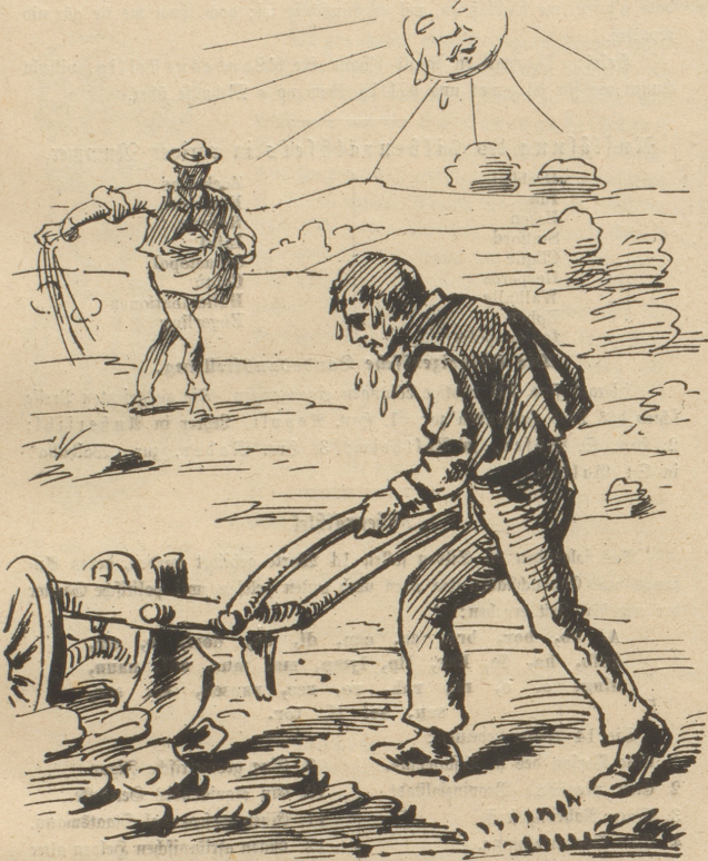
Der Bauer ist im Schweiße seines Angesichtes sein Brod.