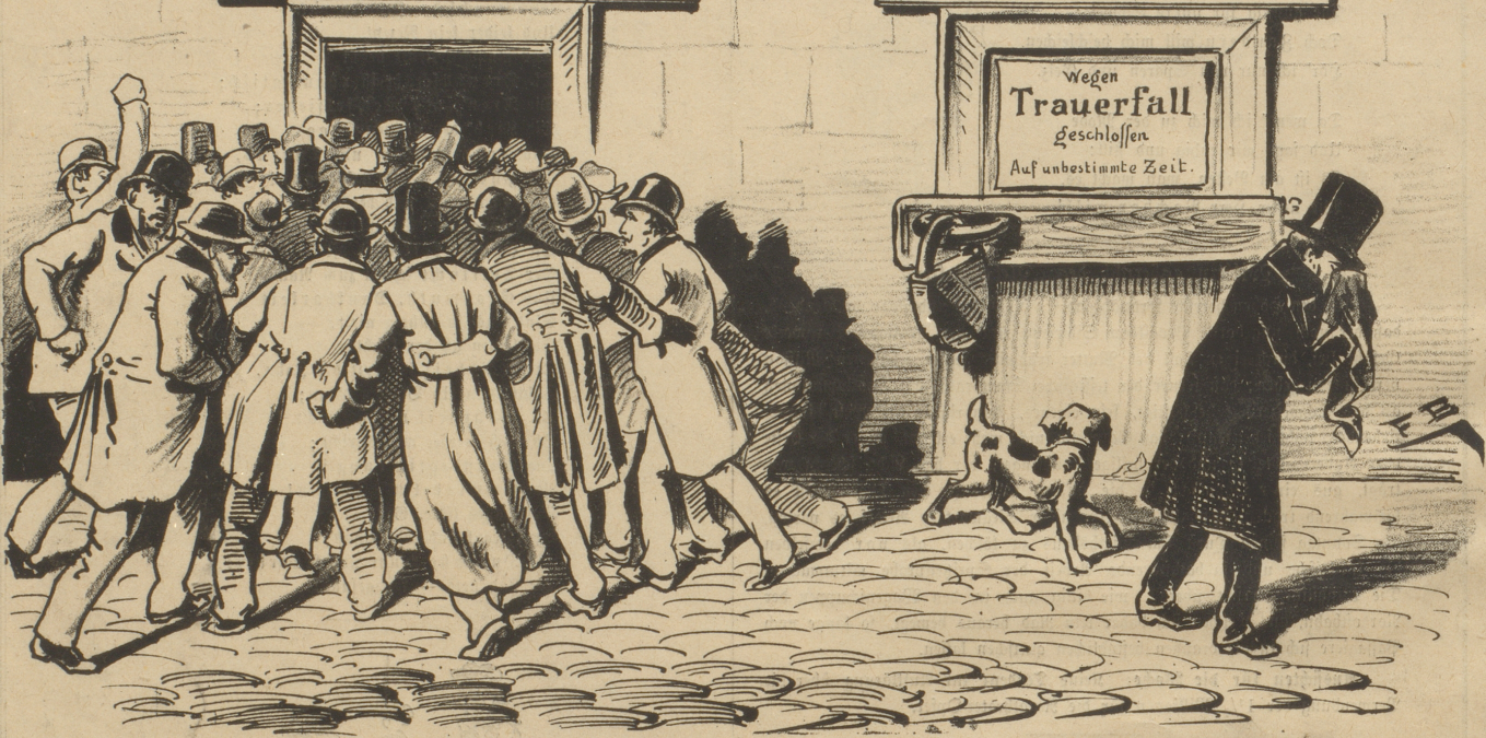
Es lebe die Baisse!