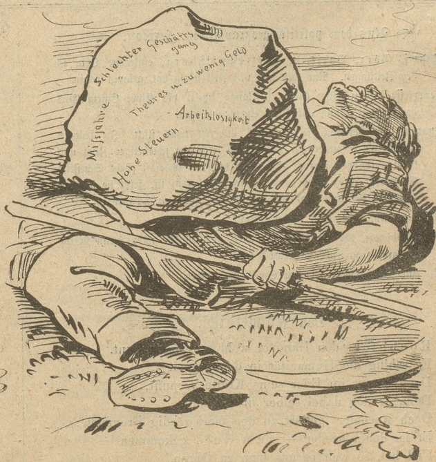
aber mit dem schwersten Stein, der auf Gewerbe und Landwirtschaft lastet, fahren sie nicht ab.