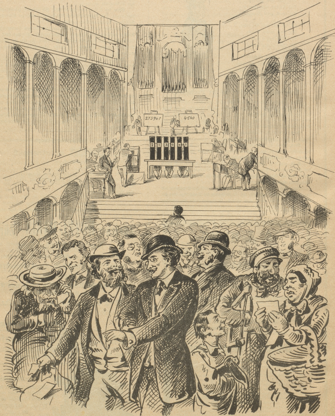
Wer in der Tonhalle den Glauben schenken liebt, daß nicht Alle den ersten Preis haben können, der gewinnt vor dem großen verbohrteten Schiffe, im Saale der Kronhalle, als süßen Trost die Ueberszeugung, daß uns dieses Jahr wieder einmal ächte und gute Landweine gebohrt hat.