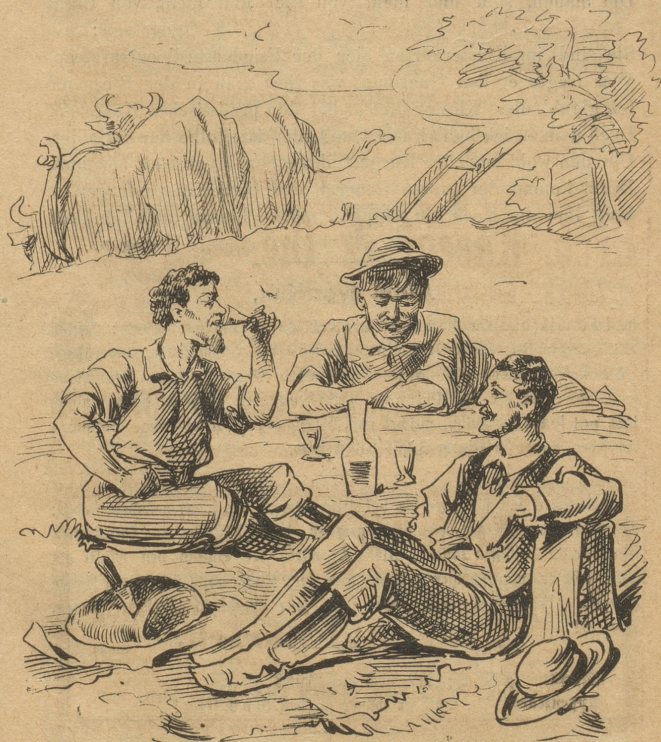
Dieses Schnäpschen zu besteuern;