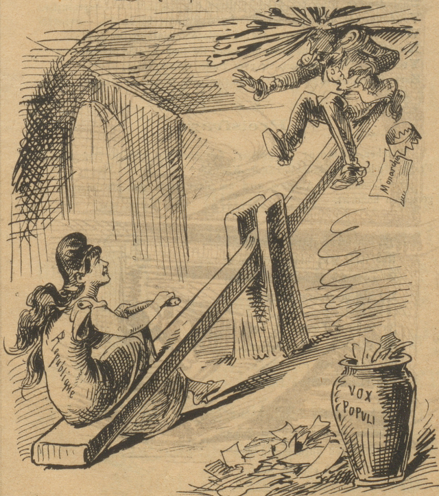
„Na, wat sagst Du denn dazu?“