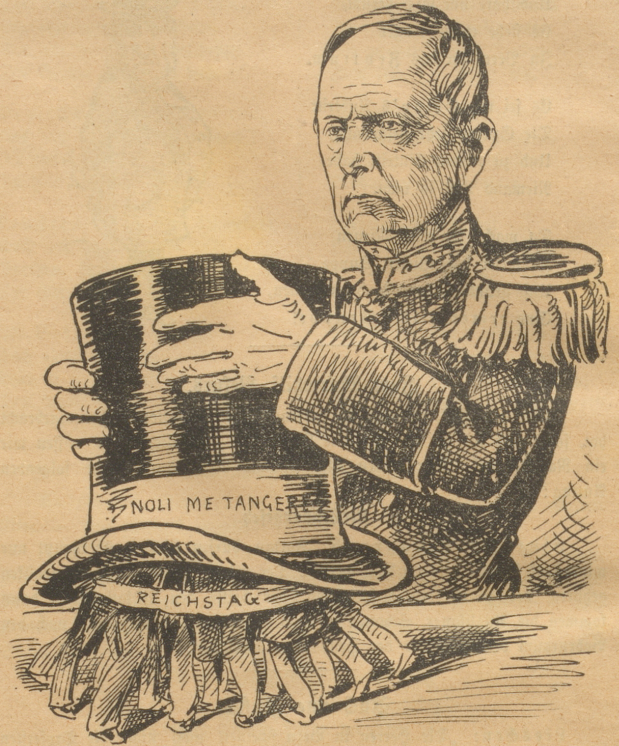
den Deutschen Reichstag sofort darunter zu bringen, hat doch der greise Molke wieder bei der Hand gehabt.