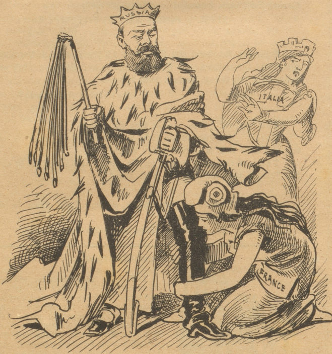
Die Freiheit küßt der brutalen Gewalt, von welcher selbst Monarchien Nichts wissen wollen, die Stiefel. Dooh!