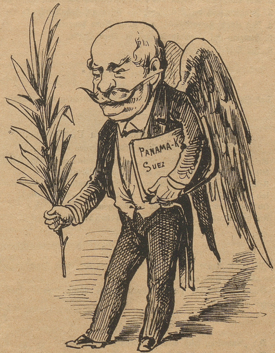
und Lesseps vom deutschen Kaiserhofe in diesem Kostüme fétirt wird.