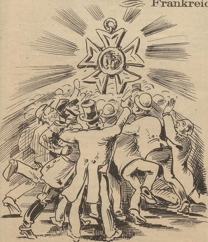
Erst kroch und drängte zu Kreuze Das Volk, Militär und Zivil!