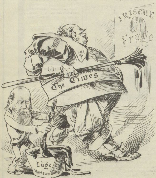
»So lag ich und so führt' ich meine Klinge!«