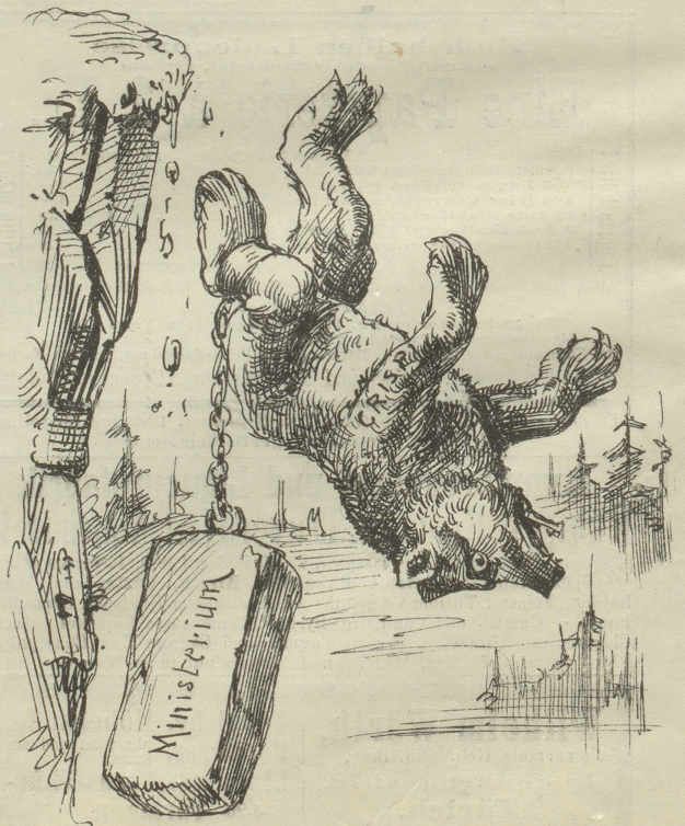
Drei! unbedachtsamer Weise in's Meer, welches ihn ohne Magen- beschwerden verschlang.