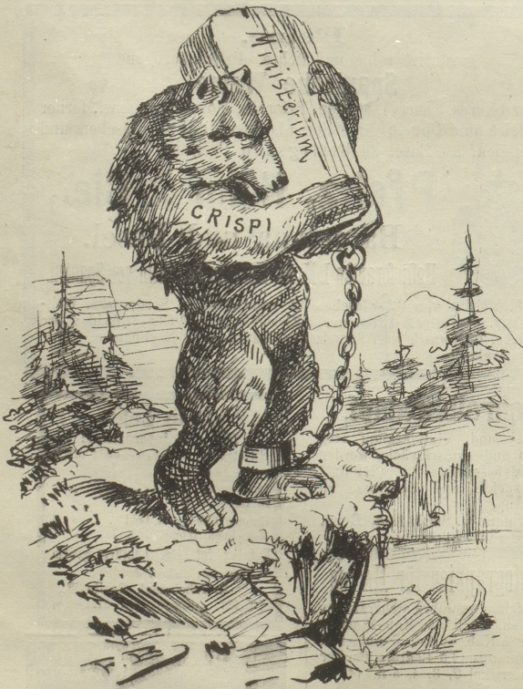
Und da ihm der Stein unbequem wurde, da warf er ihn: Eins! — Zwei —