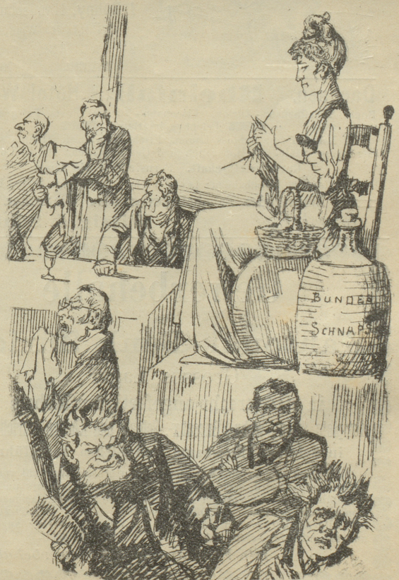
erhöht die »Helvetia« den Preis des »Brenn« (2) sprits.