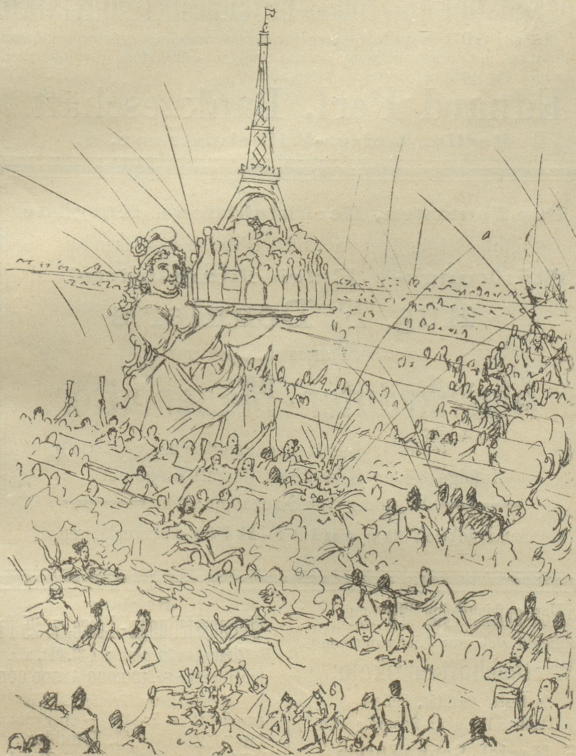
Während die »France« noch immer bewirthet,