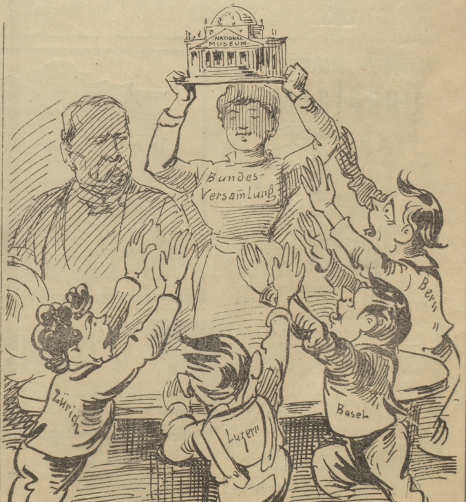
die allein hat's und die allein gib't, gelobt sei der Name des Gebers!“