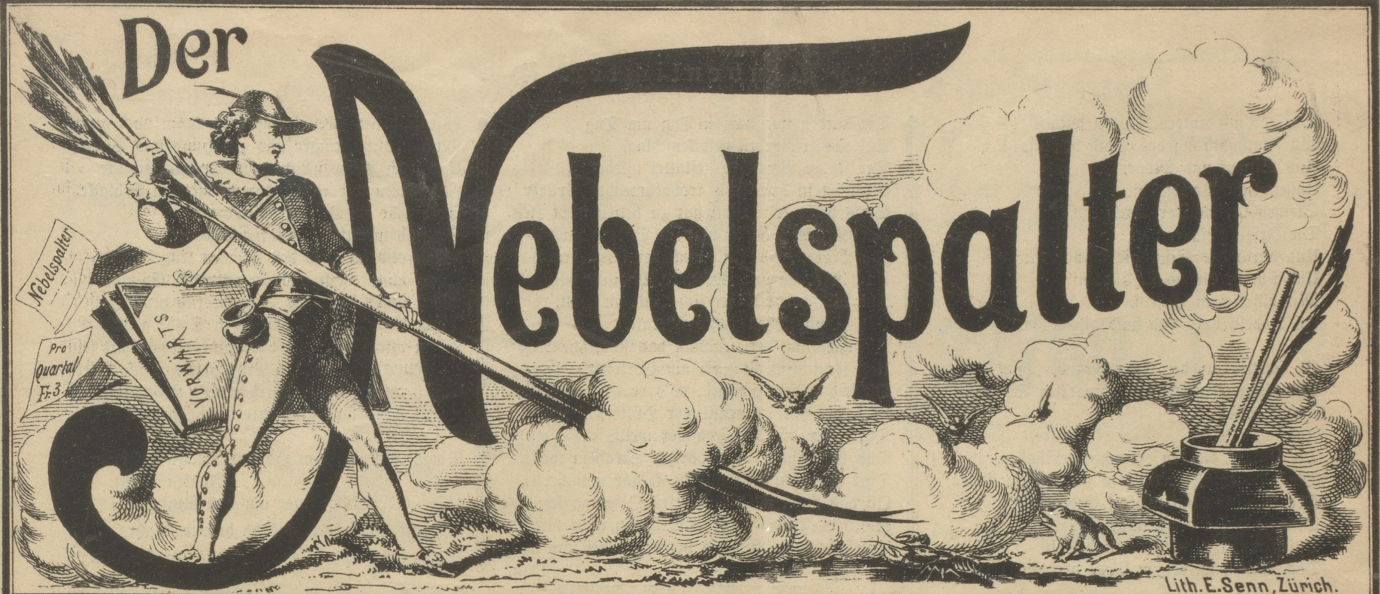
Lith. E. Senn, Zürich.