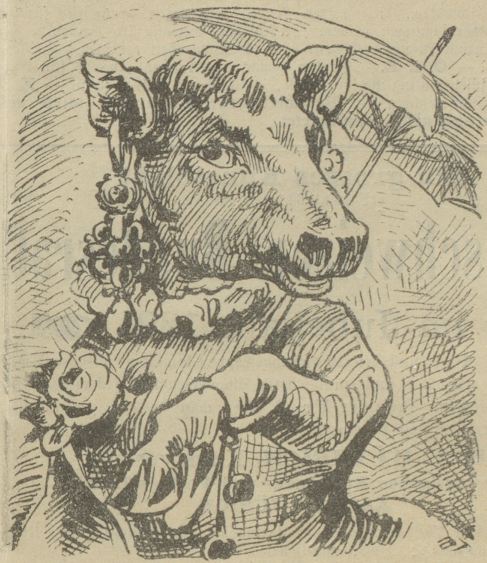
Wie man Eitelkeit pflanzt.

Man hat beschlossen, künftighin die Zeichnungen der Küher durch Ohrenmarken vorzunehmen, was natürlich über kurz oder lang den „Ohrenglanggeren“ rufen wird.