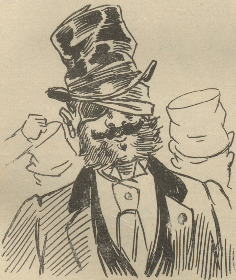
Deputirter, fin de siècle

Journalist oder Advokat, gibt und nimmt Faustschläge für die eine oder andere Meinung. Heute auf der Rechten, morgen auf der Linken und Anarchist übermorgen. Moquirt sich für den Rest.