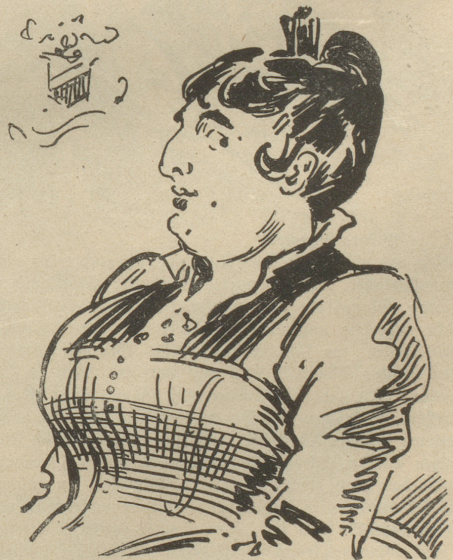
Braut, fin de siècle

Junges Fräulein, sich begnügend mit 2 Millionen, sucht die Bekanntschaft eines vermöglichen Herrn, 25 Jahre alt, mit oder ohne Kinder. Keine Agenten. Offerten unter X Y Z.