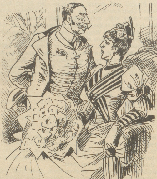
Von oben herab.

„Ist es wahr, Herr Brauswind sei mit einer Kunstreiterin verlobt?“ „Allerdings, aber es ist eine Mesalliance .““