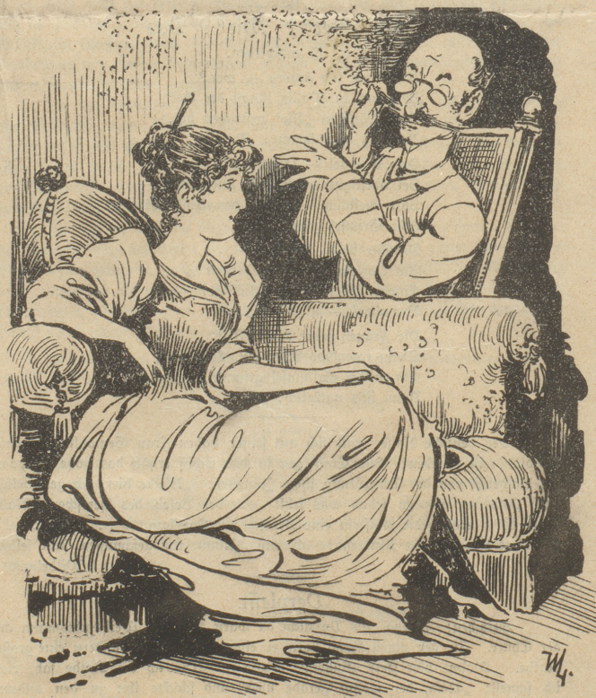
„Schöne Frau hatten doch früher zwei Händchen, ein allerliebstes Aeffchen und einen Papagei?“ „Die sind fort, denn jetzt bin ich verheirathet, und mein Mann erlegt mir das Alles.“