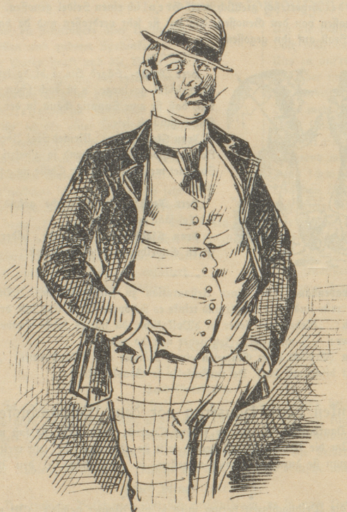
Herrgott, jetzt wird's wieder kühl, wenn ich nur meinen Ueberzieher auflösen könnte, dann hätte ich doch wenigstens etwas — zu versehen.