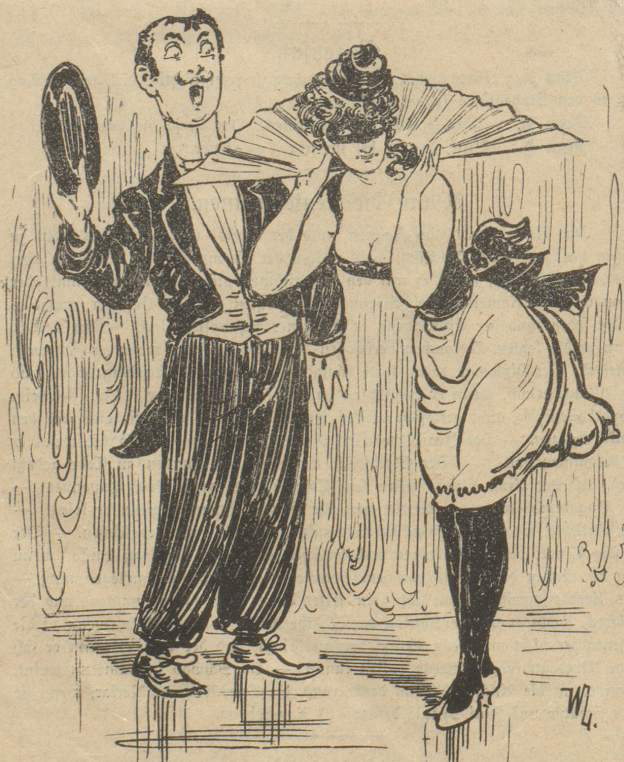
„O, ich kenne Sie; vor drei Tagen hat Sie mein Prinzipal die Treppe hinunter werfen lassen.“ „Au!“