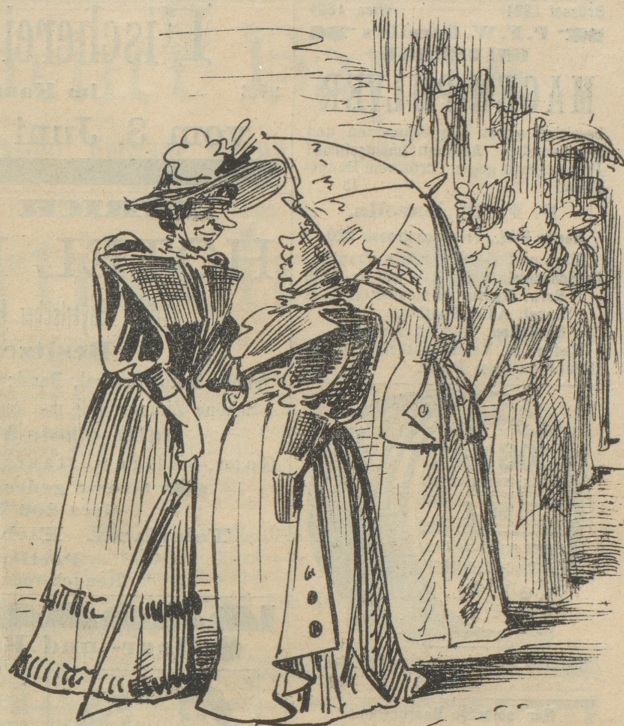
schafften aber dafür Platz für eine neue.