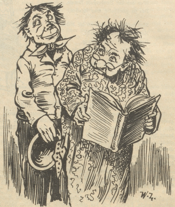
Jausbursche: „Kriegt man hier Malakatur zu kaufen?“ Gelehrter: „O, bewahre, so was gibts da nicht.“ Jausbursche: „J, so nähmt's nid übel, man hat mir gesagt, Ihr thätet's schreiben!“