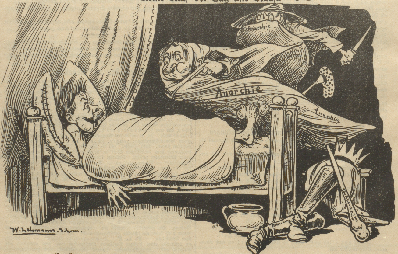
Humbert: „Jesas, Jesas! Erst die Hühneraugenschmerzen und jetzt wieder diese Nachtgespenster!“