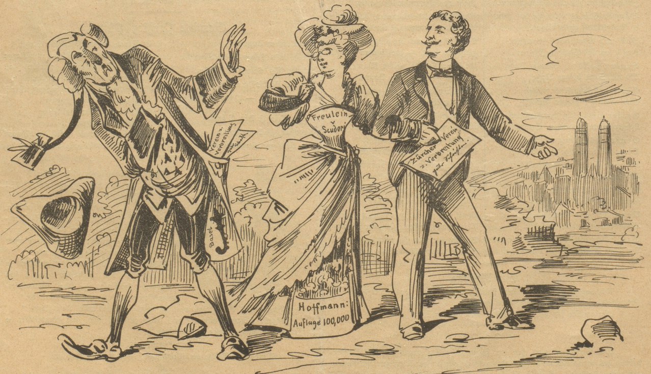
Nichts weiter als ein Beweis, daß sich um den guten Geschmack zuweilen doch streiten läßt.