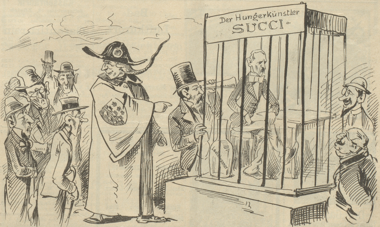
Wallis (zu seinen miserabel besoldeten Lehrern): „Nehmt Euch einmal ein Beispiel an dem da, meine Lieben. Sein Tischlein ist stets abgeräumt, er aber trotzdem immer aufgeräumt.“