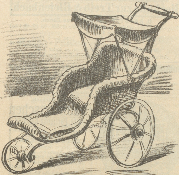
für Regierungshäupter zur Besichtigung der grauenvollen Zerstörungen von nächstlichen Revolten.