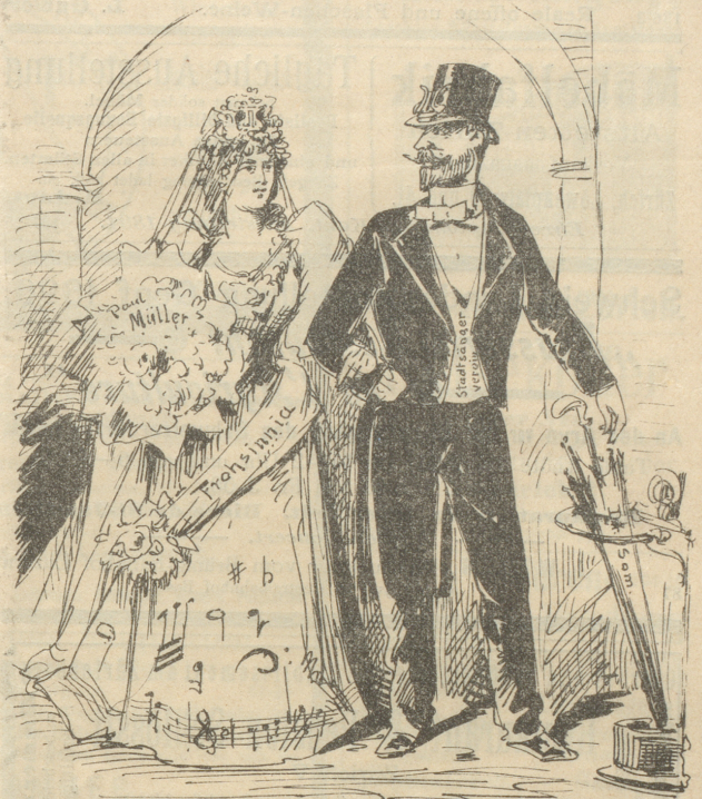
Die neueste Fuston — — „für's Leben“, Die „Scheidung“ — wird sich später geben.