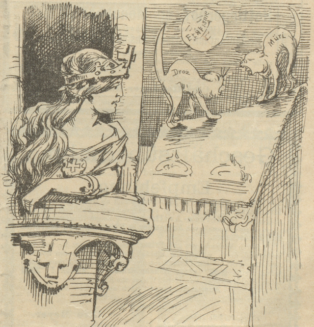
Elsa-Helvetia: „Welch' fürchterliches Klagen schallet durch die Nacht?“