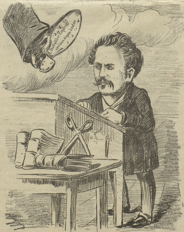
Seidel: „Ein hehres Gefühl ist es doch, je mehr man sich für andere opfert, um so sicherer darf man auf Lohn rechnen!“