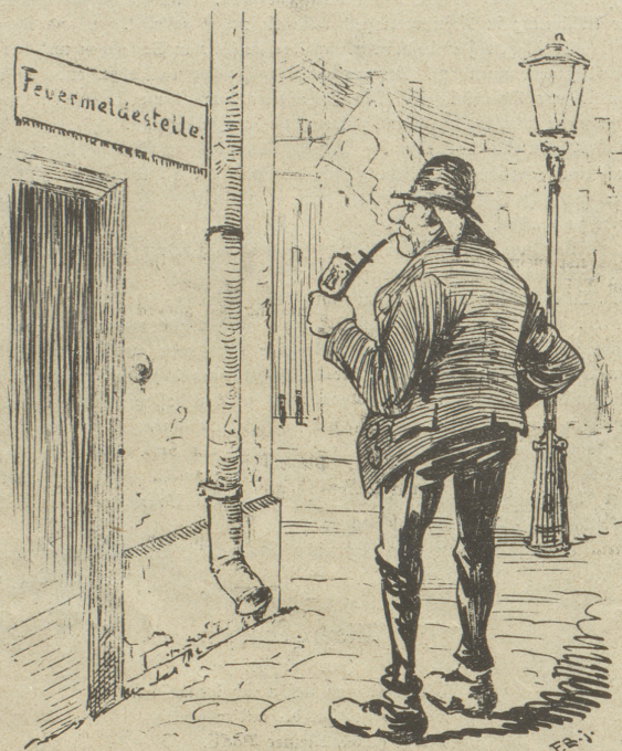
„Wie's doch in der Stadt die Leut bequem haben! Da gibts sogar Häuser, wo man die ausgegangene Pfeife anstecken kann.“