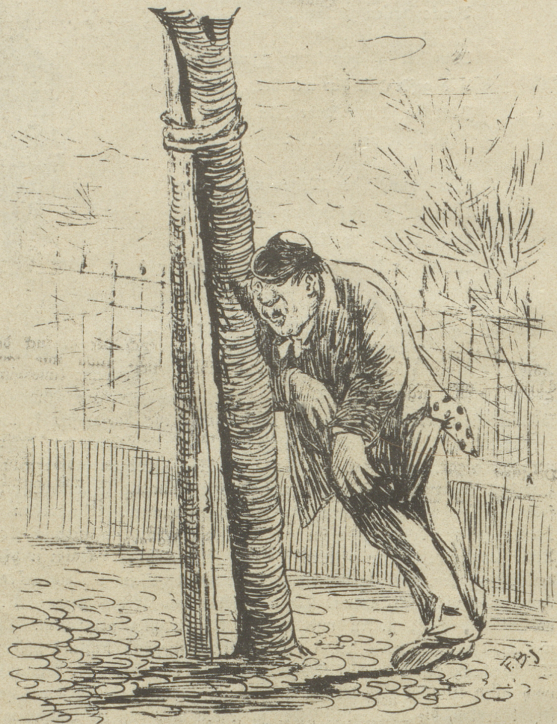
„Die sollen mir nur wieder kommen mit ihrem Sauser im Stadium! Ein aufrecht stehender Mann braucht sich so was nicht gefallen zu lassen!“