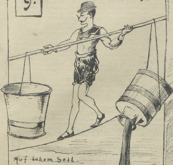
Auf hohem Seil.