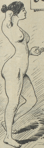
Eine arme Waise die nicht zum anziehen v. keinen rechten Arm mehr hat, bittet um ein Almosen.