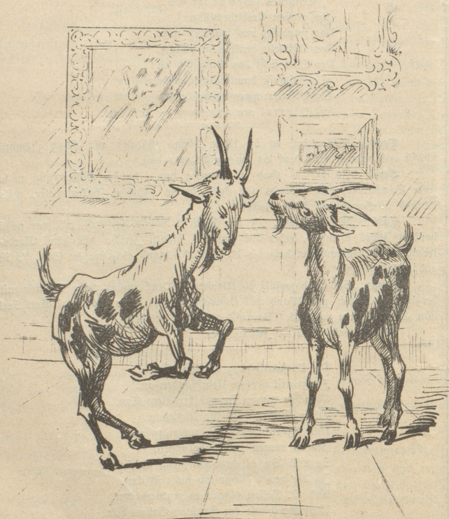
Nachricht: „Im Künstlerhaus Zürich sind zwei ältere Böckli ausgestellt, die aber bereits den kommenden Meister verraten.“