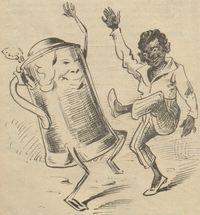
Seldel: „Das klingt so herrlich, das klingt gar so schön!“ Moor: „So was hat man in Perleberg sein Lebtag nit gesehn!“