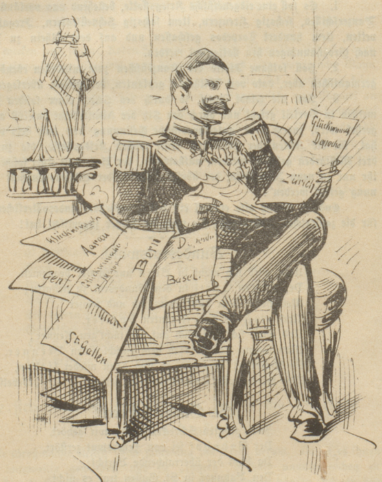
Wilhelm: „Schan, schau, diese massenhaften Depeschen aus der Schweiz. Sollte das am Ende doch eine meiner Provinzen sein?“