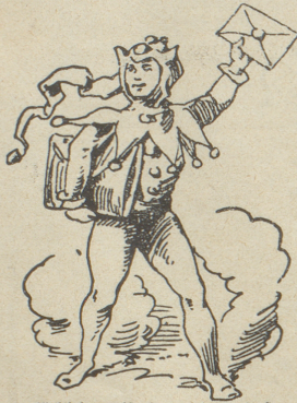
unglücklicherweise dargehan, daß er eben nur Gesandter, aber nicht ein Geschickter

R. P. i. G. Die Fertigstellung der großen Auflage des „Rebelspalter“ beansprucht zwei volle Tage und so sind wir leider außer Stande, das Portrait des neugewählten Mitgliedes des Bundesrates schon in dieser Nummer zu bringen. Wir müssen Sie also auf die folgende vertrauen. — Oho. Mag sein, daß Ihr Gedicht sich mit den Schiller'schen „Elaboraten“ ruhig messen kann, aber deshalb verwenden wir doch keine Frankomarte, es sei denn, daß Sie uns eine schicken, um Sie wieder in den Besitz dieses „Schazes“ zu bringen. — Kurg. i. B. Sie sollten nicht so schimpfen über das Pfister, sonst machen Sie sich verdächtig. Es heißt nämlich ein Sprüchlein: „Wer in dr Jugend liebt die wyße Wei, de fürcht im Alter d'Wefzistei.“ — B. i. B. Der Herr Gesandte hat sich mit seiner Rede bei den Franzosen einschmeicheln wollen und dabei