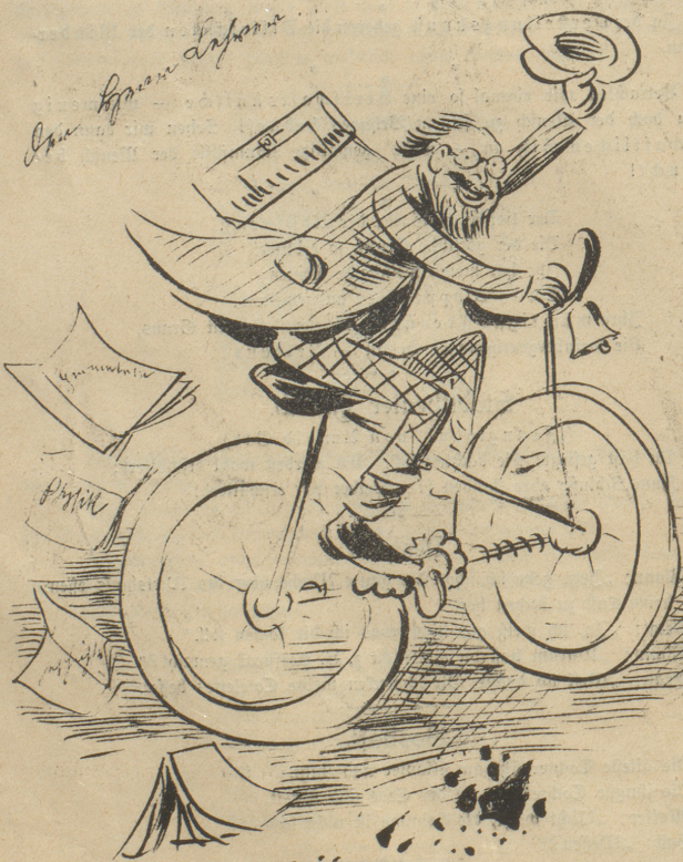
Lehrer: „Juhu, jetzt bin ich für vier Wochen die Stricke los!“