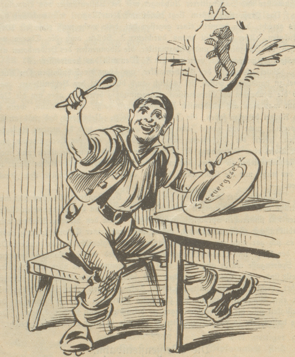
Appenzell A. Rh.: „Na, das Supplein hab' ich flott ausgeessen! Für das Ländchen muß man auch was thun können!“