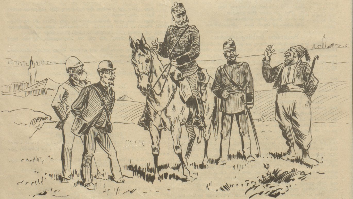
Demnächstiger Zeitungsbericht: „Als unsere auf den Kriegsschauplatz abgeschickten Offiziere und Reporter daselbst ankamen, war leider nur noch der Platz da — der Krieg aber längst vorüber.“