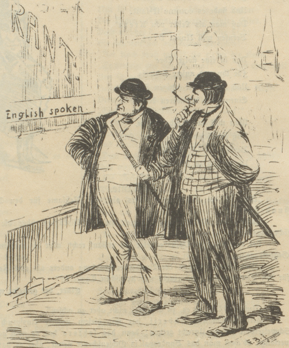
„Du, hier gehen wir nicht hinein; da spucken die Engländer!“