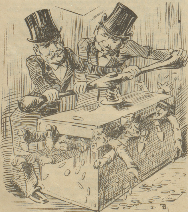
Wenn die Bahndirektionen ihre Bahnbüffets verpachten, drücken sie heraus, so viel sie nur immer können und wenn sie's herausgepreßt haben.