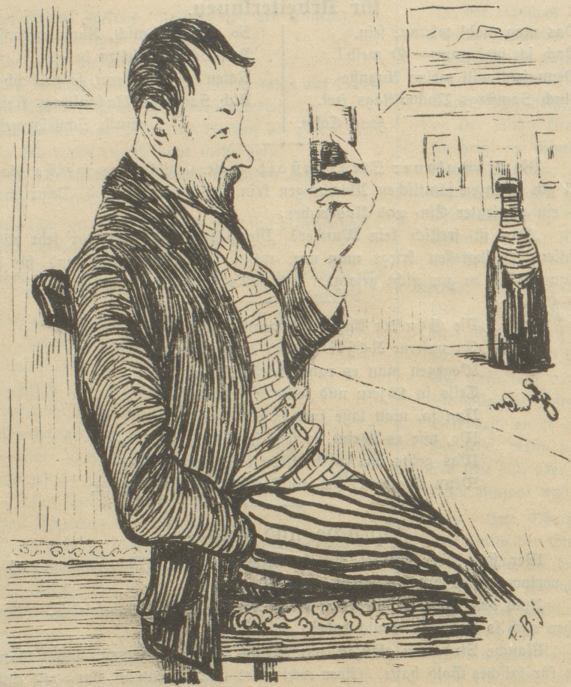
„Des Lebens ungemischte Freude wird keinem Sterblichen zu Teil.“