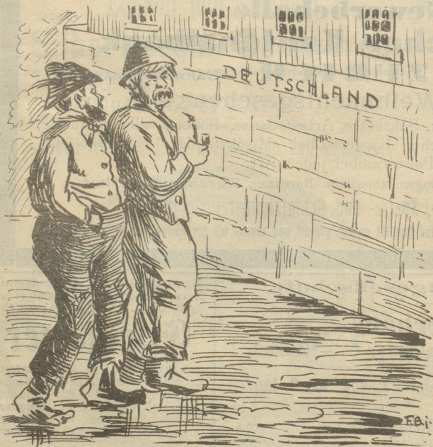
„Du Willem, guck mal, det is'n Ideal von'n Zuchthaus — da wird man nu was globste — rausgeschmissen!“