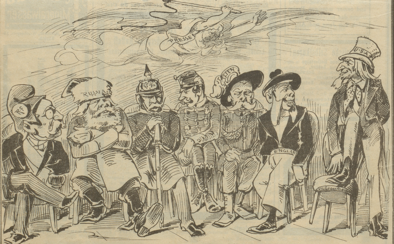
Jonathan: „Fort da mit der Presse; jetzt bin ich die siebente Großmacht!“