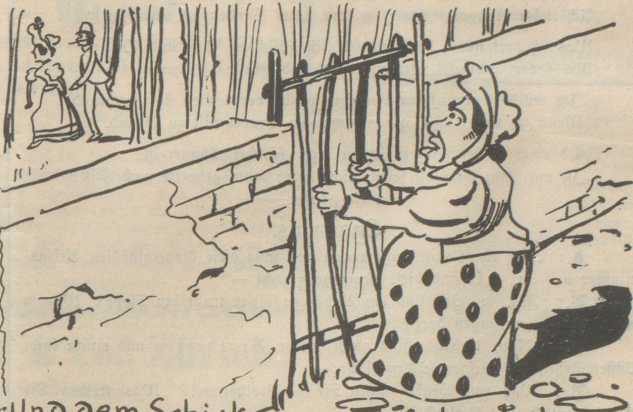
2-Und dem Schicksal getrübt