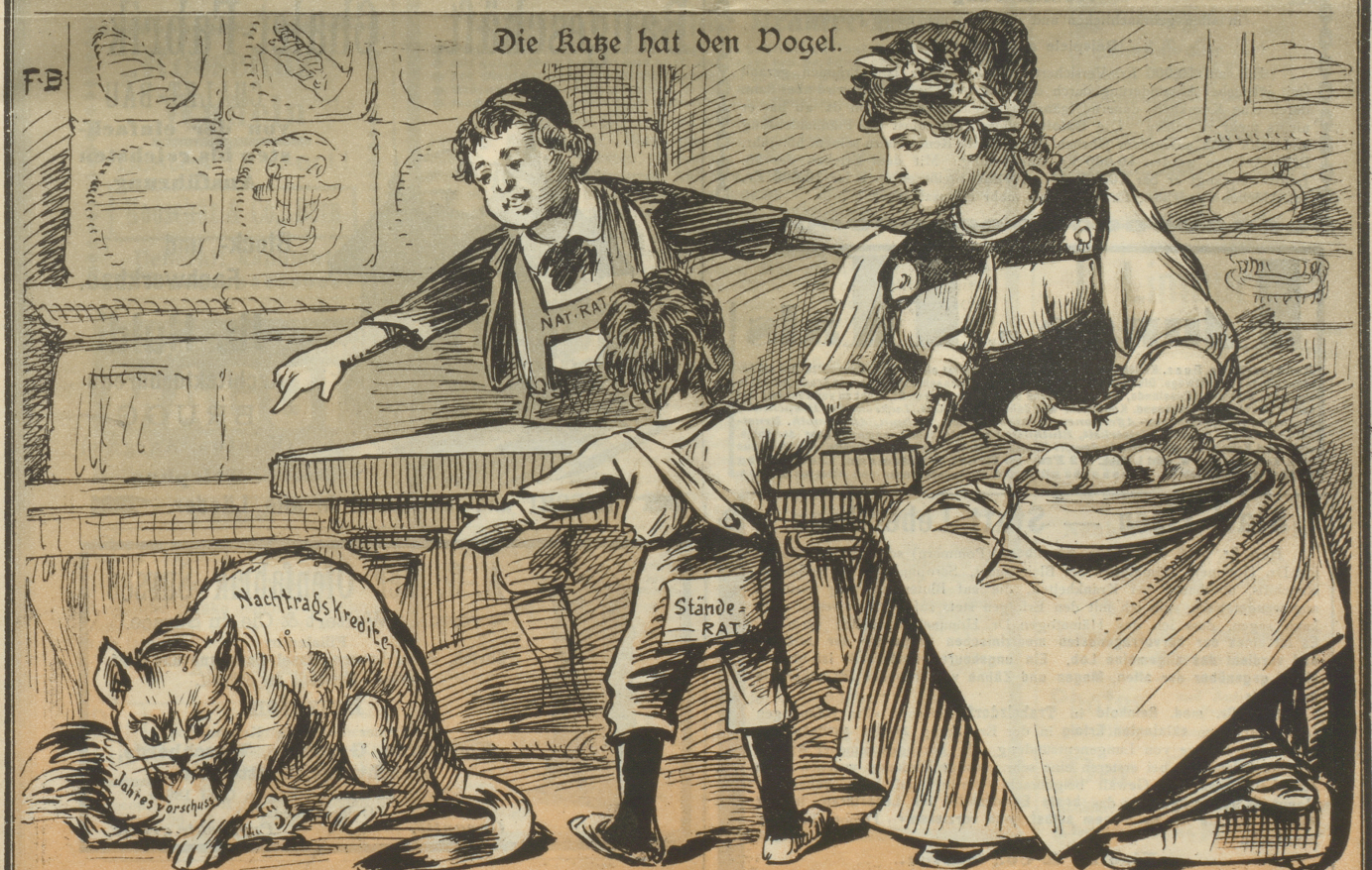
Knaben: „Mama, sieh doch nur, der Mige hat unser Hühnchen!“ Mama: „Geschieht ihm schon recht; warum hat es so laut gegedert!“