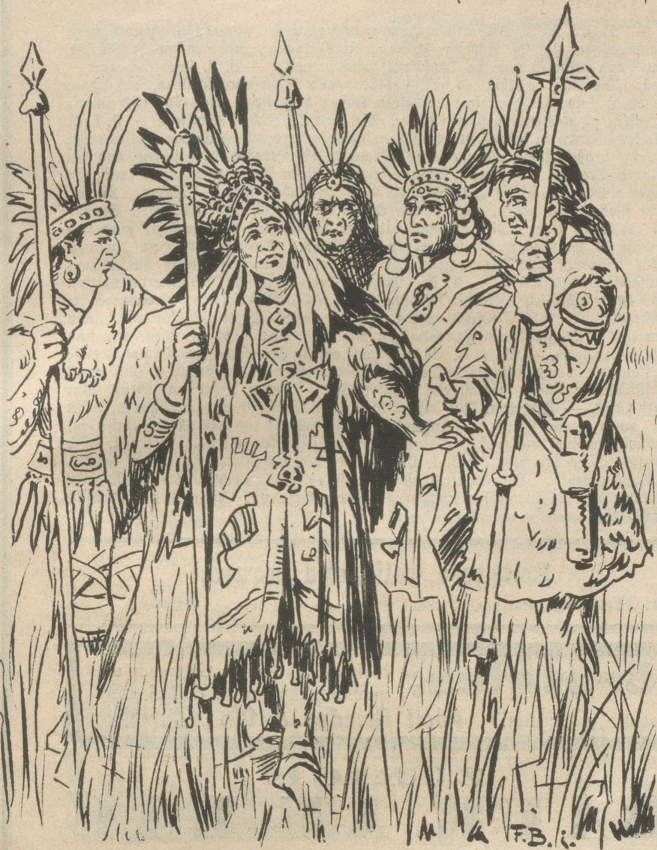
Indianer im Kriegsrat.

— — — An ihren Werken sollt ihr sie erkennen! — — —