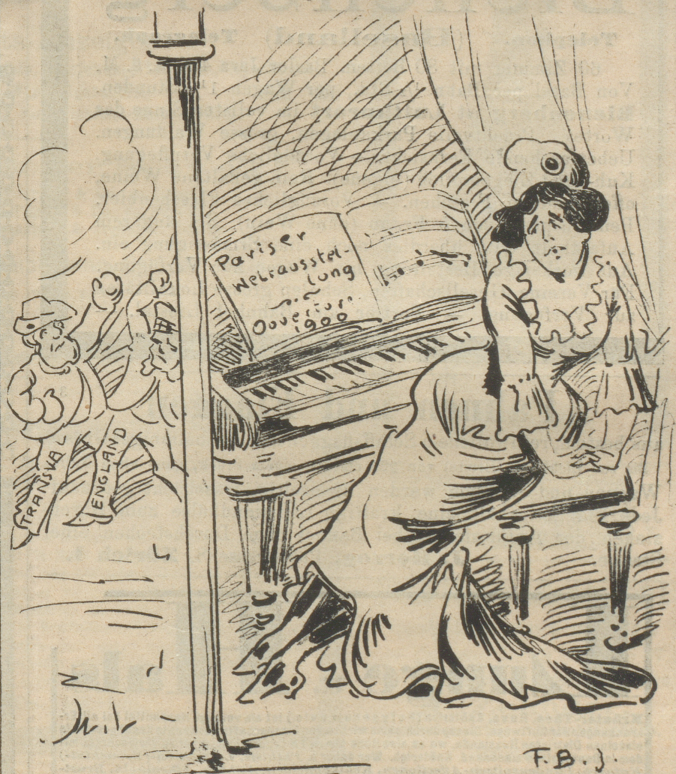
»Mon Dieu! Wenn's keine Ruhe gibt da draußen, kann ich mein Konzert nicht spielen.