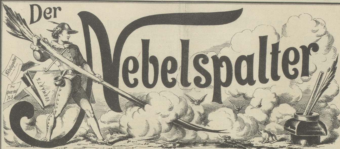
Lith v. Butz & Fleursheimer