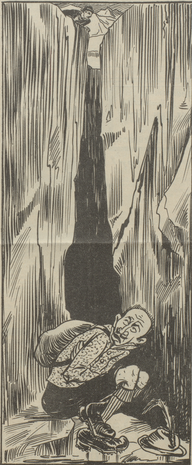
Tourist (in der Gletscherspalte): Lassen Sie man rasch das Gletscherseil runter; ich sitze ja hier wie auf glühenden Kohlen!