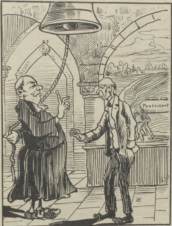
Wollen sie wieder ein Mal für ihre Intoleranz „berühmt“ werden!