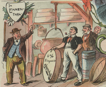
IM EMMEN-THAL ZORN unter den Käshändlern, weil das Eingewicht abgeschafft wird.

Heiterkeit, weil die alten Mannen heute noch auf die Schulbank müssen.