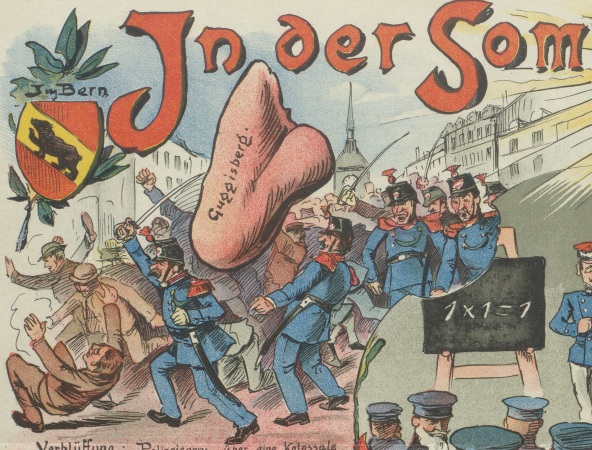
IM BERN Verblüffung im Polizeicorps über eine kolossale Nase die plötzlich unter die Mannschaft fiel.