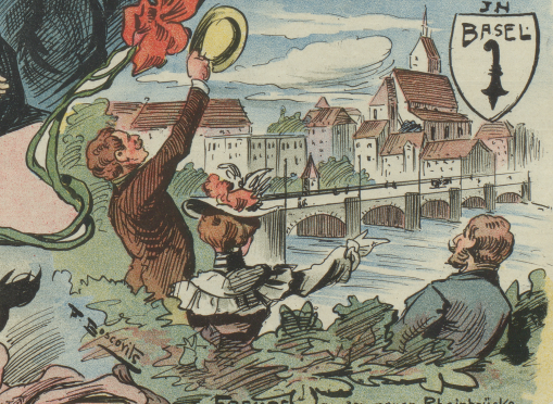
IM BASEL FREUDE an der neuen Rheinbrücke von Stein, obchon von einem Holzmann ausgeführt!

Heiterkeit, weil die alten Mannen heute noch auf die Schulbank müssen.