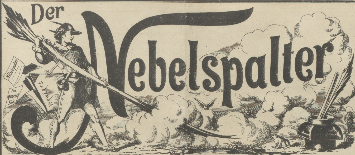
Lith v. Butz & Fleursheimer