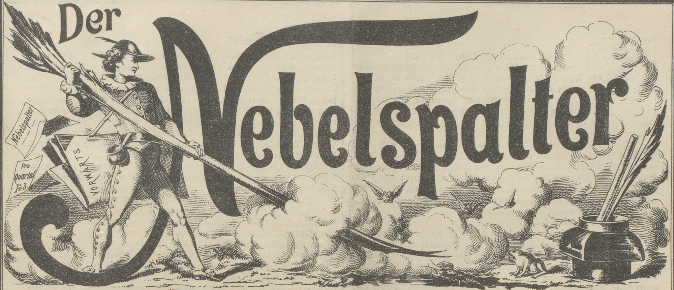
Lith v. Butz & Fleursheimer