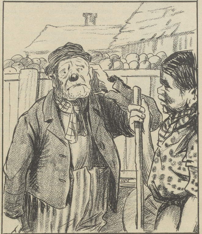
„Herjeses, Ma, bringst du alli Oepfel wieder hei?“ „Ja, wäge dem verd . . . russisch-japanische Chrieg wott's niemer ha, wil's luter Kaiser Alexander sind.“