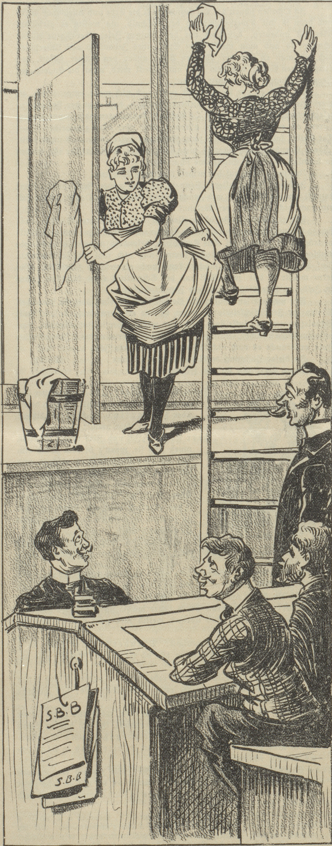
Während der Fensterwasche dürfen die Beamten das Bureau nicht verlassen.