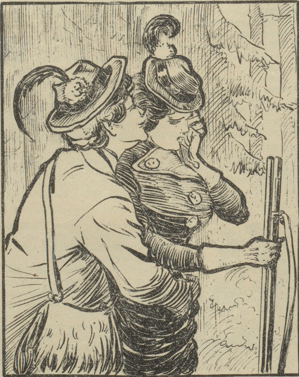
Als der Graf mit fräulein Agnes auf dem Anstand war, nahm er keinen Anstand, den Anstand zu vergessen.