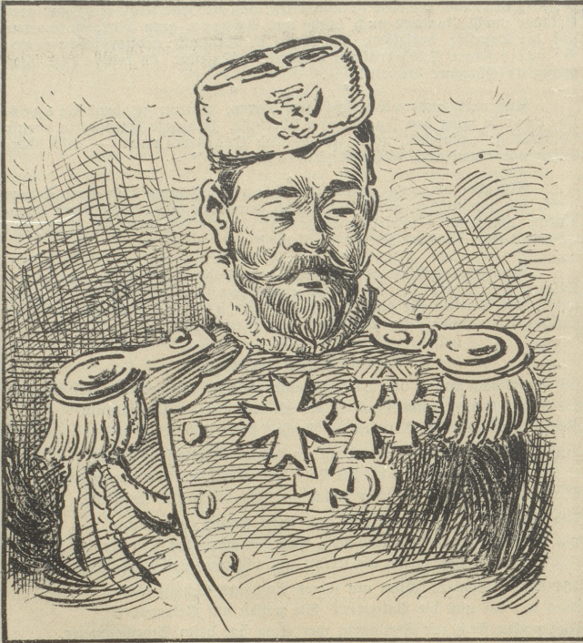
Die Kreuze des Zaren.