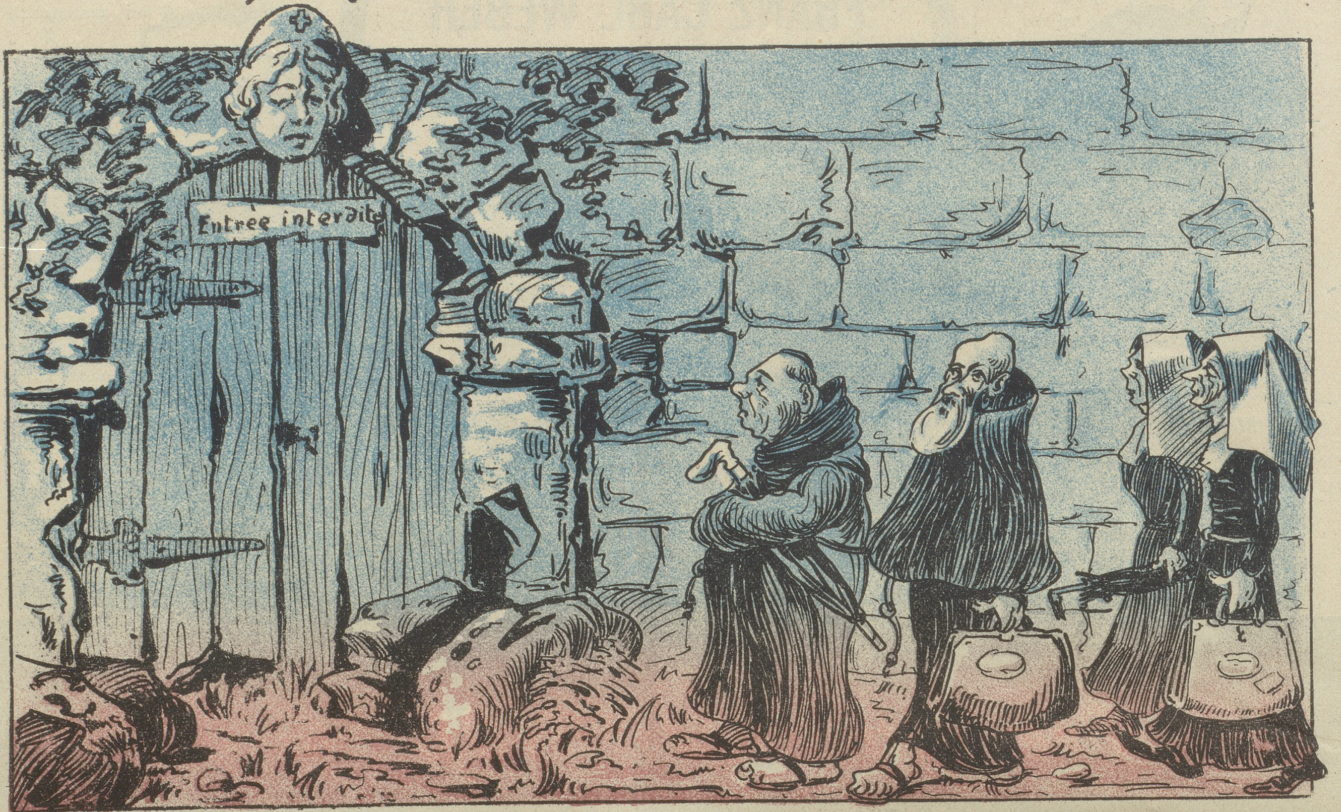
Empfang, wenn „mittelalterliche“ Franzosen kommen —