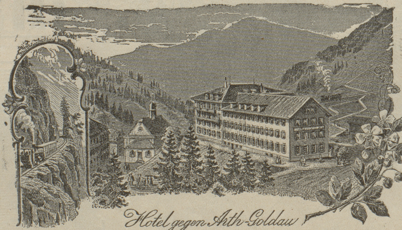
Hotel gegen Arth-Goldau

„Das Klösterli ist der geschützte Kurort des Rigi, und dennoch entbehrt es in der weiten Mulde der Sonne nicht, ist selten von Nebeln heimgesucht, hat eine milde, sich ziemlich gleichbleibende, keinen grossen Schwankungen unterworfenen Sommertemperatur u. gewährt durch den Anblick der umliegenden grünen Alpweiden, Felsen und Waldungen das freundlich Angenehme eines abgeschlossenen, stillen Bergtales mit köstlicher, reiner, mild-erregender Luft. Der Aufenthalt erweist sich namentlich für sensible, reizbare, noch schwache Rekonaleszenten, für Lungenkranke von mittlerer Resistenzfähigkeit, für Nervenkrankte und Geschwächte, welche einer allmählichen anhaltenden Stärkung und Erfrischung bedürfen, als sehr heilsam. — Nahrung, Bäder, Milch, Molken, treffliches Trinkwasser, nahe Waldung mit Ruhebänken und die von den herrlichsten Aussichtspunkten beglückten Spazierziele dienen als erfolgreiche Adjuvantien.“