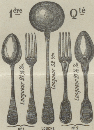
Zur gef. Auswahl Form Nr. 1 oder 2.

Verlangen Sie Spezial-Kataloge für Uhren.