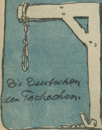
Die Deutschen den Tschechen.