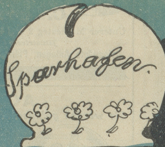
Der S. B. B.