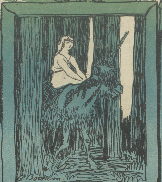
Das Schweigen im Walde.