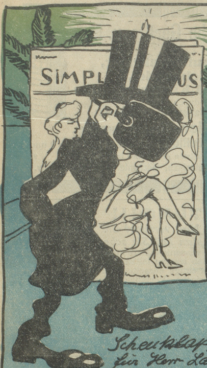
Scheutklappen für Herr Lauterburg in Bern, dass er die unmoralischen Sachen nicht mehr sieht.